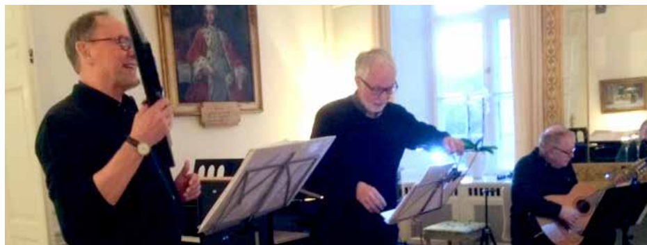
"Den jyske Bellman-trio":