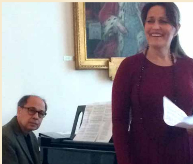
Årsmødet på den svenske ambassade, d. 5/2 2018